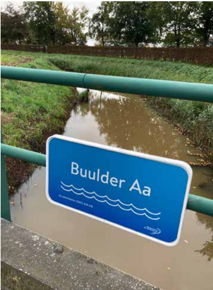
Buulder Aa (tussen Maarheeze en Leende, parallel aan de A2)

Het wemelt van de beekjes en stroompjes in het rijk van de 120 km lange Dommel. Hun vaak mooie namen prijken op talloze bruggetjes. In de vorige Zegjes kwamen er al een aantal langs. Dit keer de Buulder Aa.