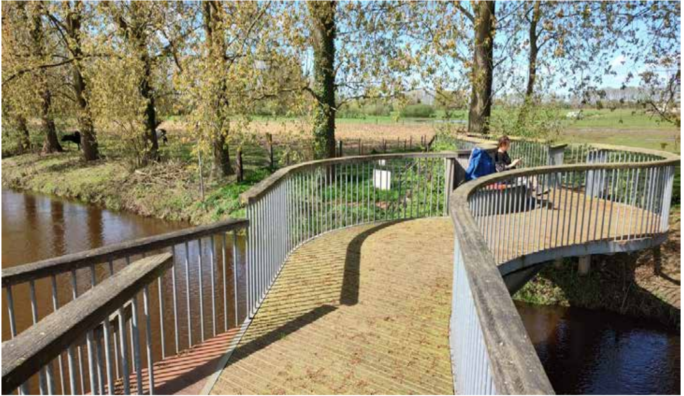
Over de Dommel (St. Oedenrode)