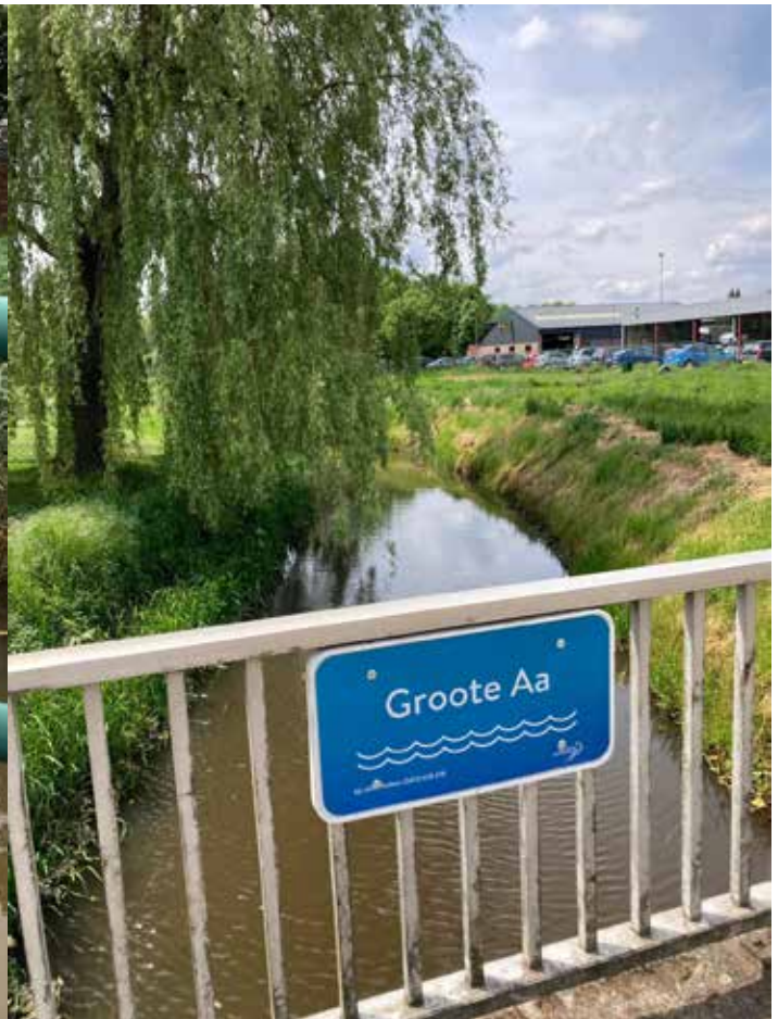
Groote Aa (aan de Nieuwendijk in Heeze)

De Buulder Aa ontspringt ten oosten van Hamont, zoals zoveel andere beekjes in België, loopt langs Budel (vandaar de naam) en langs kasteeltje of villa Cranendonck om uiteindelijk bij Leende in de Strijper Aa uit te monden. Samen gaan die twee verder als Groote Aa. Langs de Buulder Aa liggen verschillende natuurgebieden en sinds 2012 wordt ook hier door meanderen (het aanbrengen van bochten) beekherstel uitgevoerd.