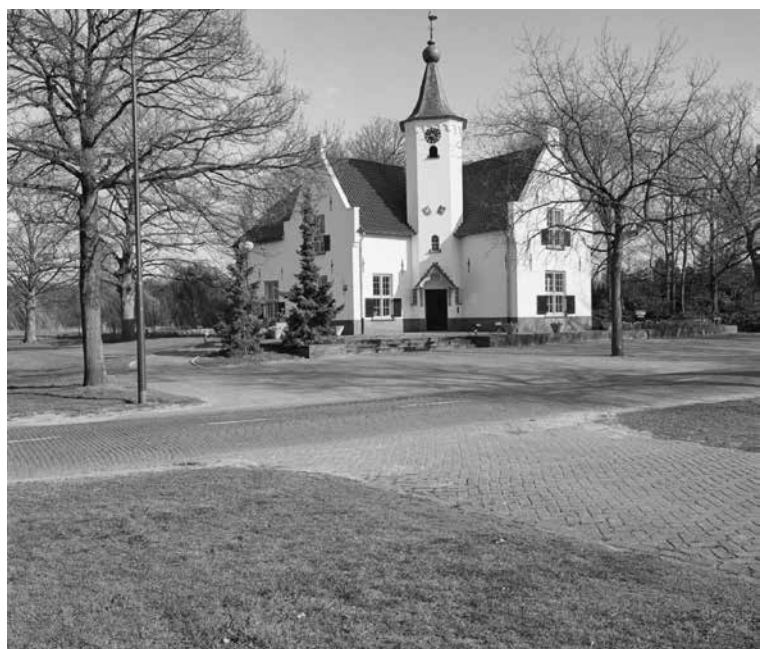
Kasteeltje Cranendonck (vlakbij Soerendonck)