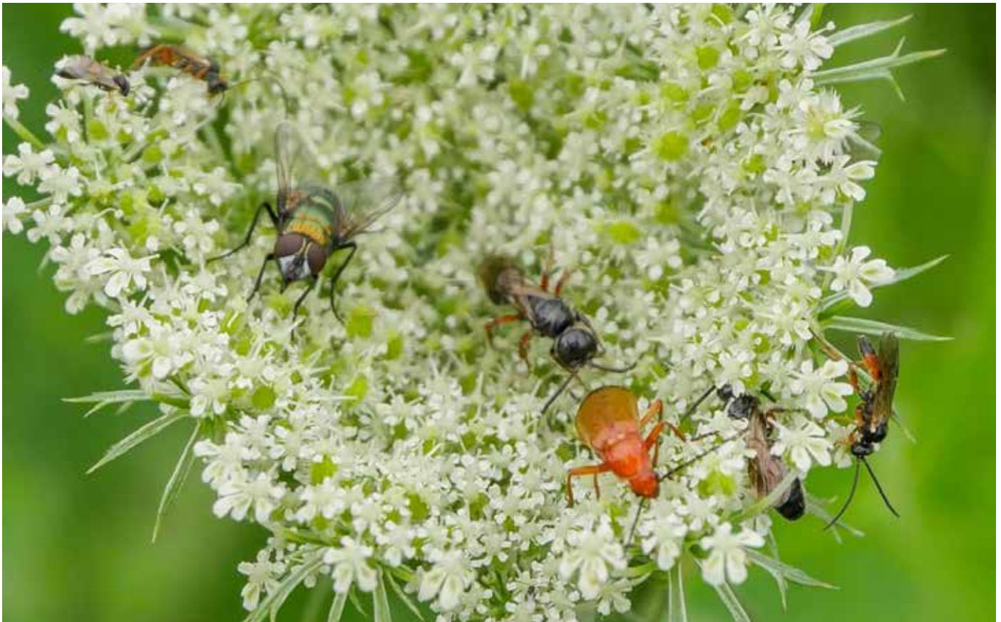
Biodiversiteit op z'n mooist!